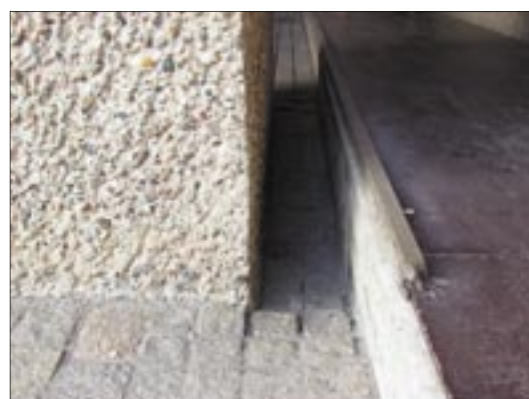
Stor svange mellom rampe og søyle.