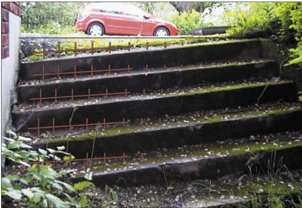
Armeringsjern borres ned i eksisterende trapp, og en forskaling settes opp.